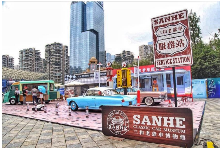
8. 2017年9月易车网中国国际老爷车展;