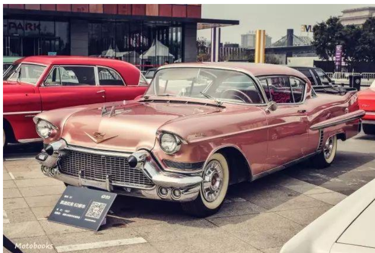
9. 2017年10月成都大学汽车+文创国际设计周;